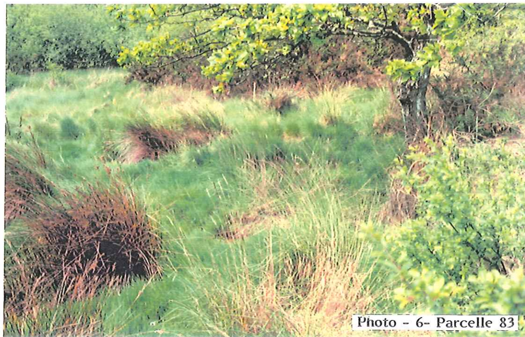
Photo - 6- Parcelle 83