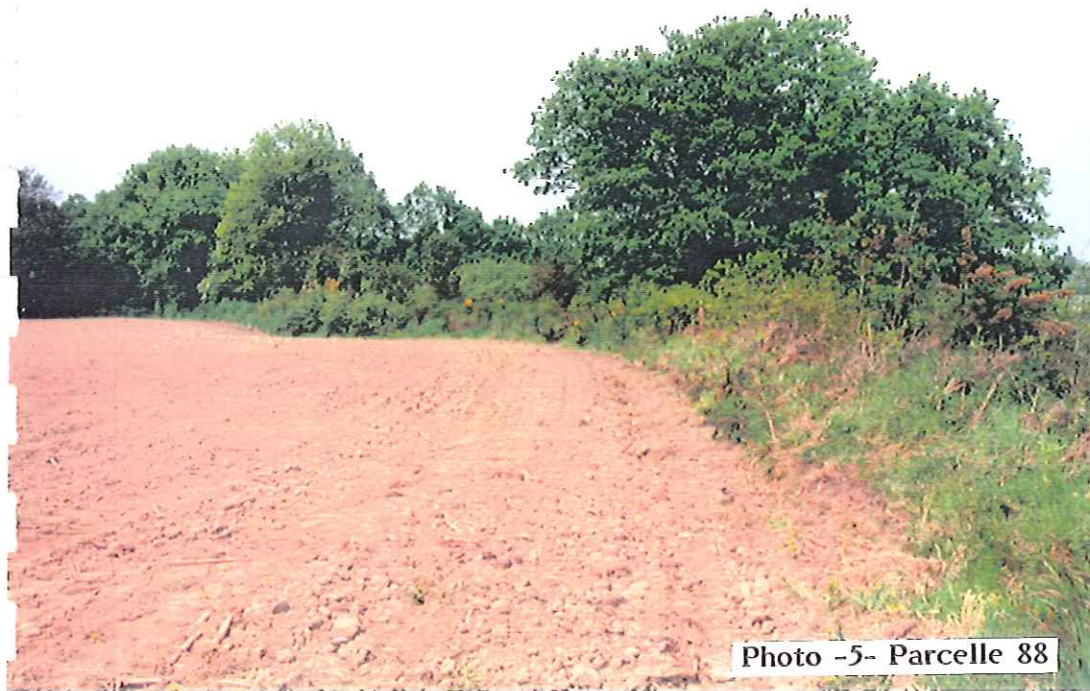
Photo -5- Parcelle 88