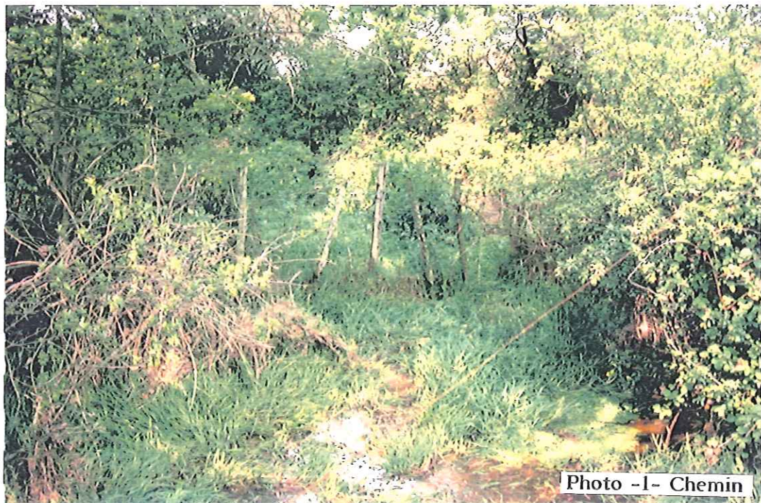
Photo -1- Chemin