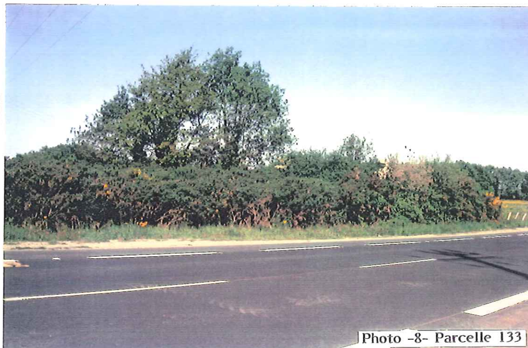
Photo -8- Parcelle 133