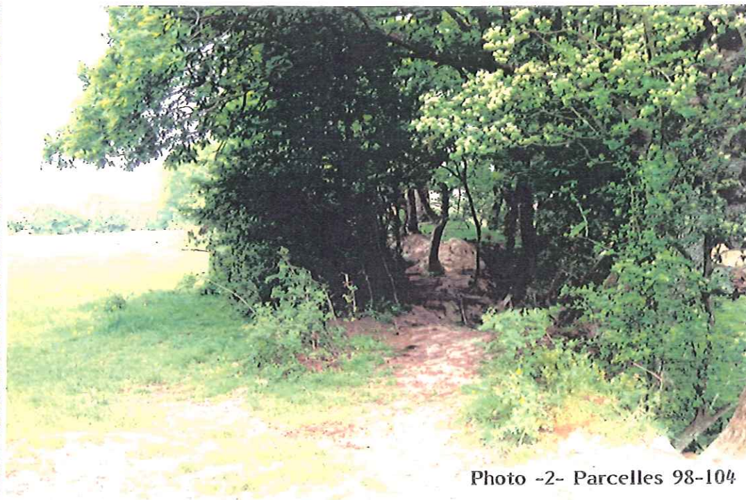
Photo -2- Parcelles 98-104