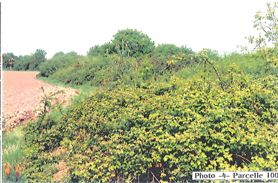
Photo -4- Parcelle 100