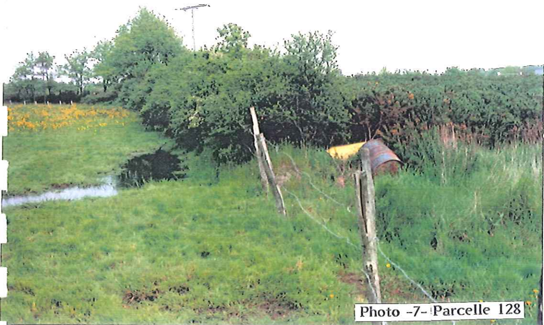
Photo -7- Parcelle 128